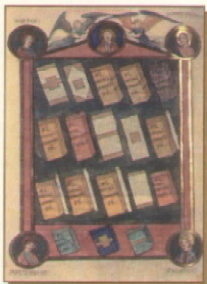
MS. lat. 9661 (Bibliothèque Nationale, Paris)